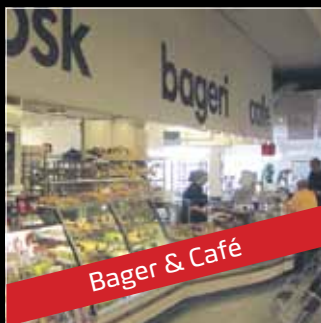
Bager & Café