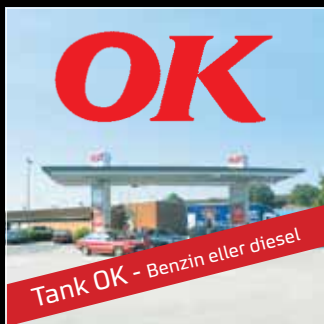
Tank OK - Benzin eller diesel