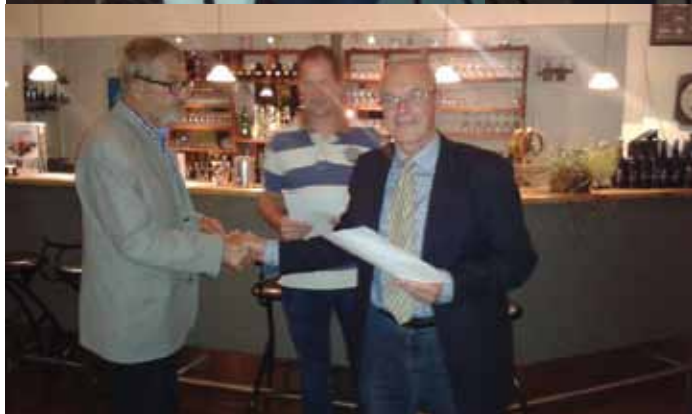
Vinderne af sejladserne mandag og tirsdag.