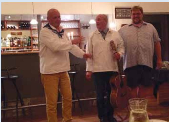
FU. på slap line under afriiggerfesten.