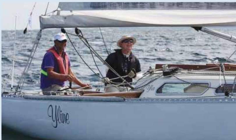
Yline vinder af Dansk 2 Star 2014