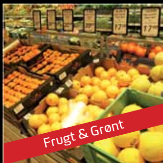
Frugt & Grønt