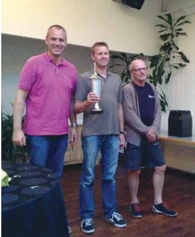
Vinderne af Folkebådenes Klubmesterskab 2014

Efter sidste sejlads havde vi fællespisning med familie, samt præmieoverrækkelse.