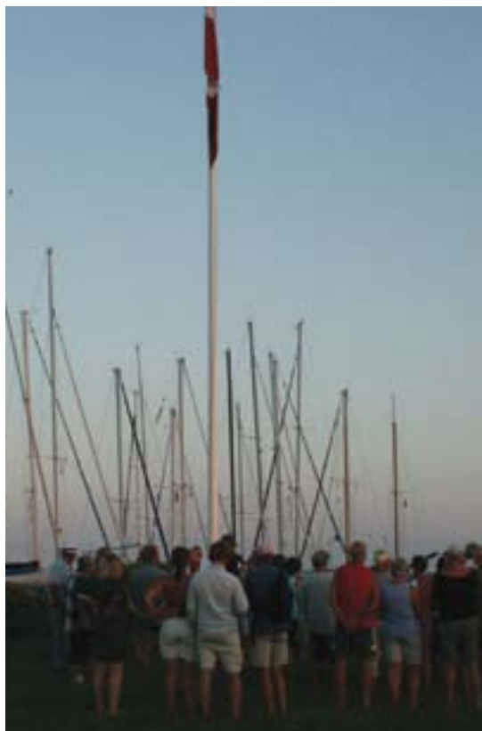
Flaget synges ned på Birkholm.