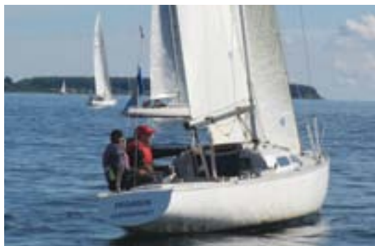
Dag 2: Let luft.