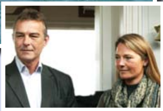
Nyt værtspår i Kerteminde Sejlklub